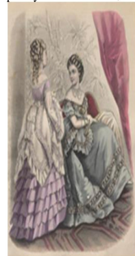
kobiece stroje balowe, XIX w., Tygodnik Módi i Powieści, 1871, Nr 36

Ziemianie, szczególnie ci, którzy mieli córki na wydaniu, często w okresie karnawału przebywali w miastach, w wynajmowanych mieszkaniach lub domach. Przywozili ze sobą