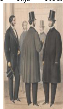
męskie stroje balowe, XIX w., Magazyn Módi i Nowości Dotyczących Gospodarstwa Domowego, 1861, Nr 8

Bale dzieliły się na publiczne, tzw. reduty, często mające cel charytatywny, oraz prywatne. Na bale udawano się koniecznie pojazdem kierowanym przez stangreta, zaczynały się zwykle późnym wieczorem i trwały nierazdo aż do świtu. W porządnym lokalach, w cenę biletu wliczone było śniadanie. Same zaś tańce odbywały się w pięknie ozdobionych salach, a gości częstowano szampanem. Popularne były maskarady, czyli bale maskowe, na których chętnie meldowali się nie tylko ziemianie, ale przedstawiciele wszystkich stanów. Maski, popularnie zwane larwami , pozwalały nawet prostemu kuchcikowi zatańczyć z hrabianką.