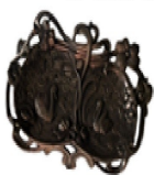
tacka na wodę rísang, XIX/XX w., z kolekcji prywatnej P. Michniewskich

Tu stała sztaluga, jeśli pani miała zakusy artystyczne. Znalazło się miejsce na stolicek do robótek ręcznych, zwany nicakiem . Na kominku - oczywiście niezbędny zegar. Ciekawa jest etymologia nazwy buduar - z francuskiego oznacza ona bowiem pokój, w którym spędza się czas, będąc w złym humorze (rzec by można dąsalnia ). Czyżby szlachcianki często były niezadowolone?