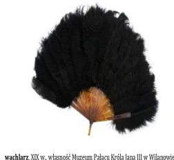
wachlarz, XIX w., własność Muzeum Pałacu Króla Jana III w Wilanowie

Muzeum Narodowego w Warszawie, domena publiczna.