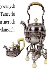
garnitur do herbaty, XIX w., własność Muzeum Zamkowego w Sandomierzu