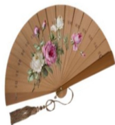
wachlarz, 1900, własność Muzeum Narodowego w Kielcach

MJK Muzeum Józefa Ignacego Kraszewskiego w Romanowie