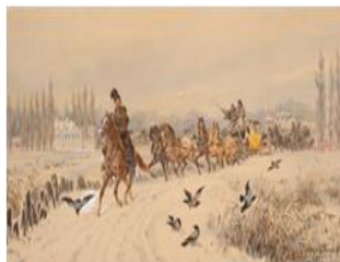
Juliusz Kossak, Powrót kuligiem z zabawy , 1877, ze zbiorów Muzeum Narodowego w Warszawie

B iały karnawał w ziemiańskiej siedzibie,