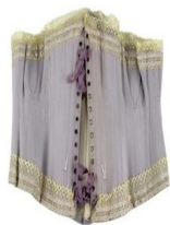
gorset, XIX w., ze zbiorów Muzeum Narodowego w Lublinie

Ważną część buduaru stanowiła gotowalnia, z jej głównym elementem - toaletką. To tu piękne ziemianki gotowały się na bal. Chociaż te najbardziej huczne taneczne spotkania odbywały się raczej w miastach, to i w ziemiańskich siedzibach nie stroniono od mazurów czy polonezów, do których przygrywała kapela z wiejskiej karczmy.