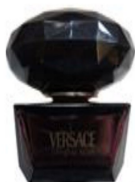
flakonik na perfumy, XX w., własność Muzeum Zamoryskich w Kozłowie

Szkatułki na biżuterię kryły niezliczone brosze, pierścienie, zapinki. Matrony i ciotki stroiły swe podopieczne na wydaniu, by te zachwyciły zamożnych, dobrze sytuowanych przyszłych mężów. Nie szczędzono więc pieniędzy na kokardy, ozdoby i piękne stroje. Kwestia ubioru balowego była niezwykle ważna, ważniejsza chyba nawet dla samych dam niż dla obserwujących je mężczyzn. Panie wymieniały opinie na ten temat na długo przed samym balem i chętnie komentowały stroje swoich rywelek.