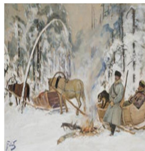
Julian Fałat, Scena zimowa z polowania , 1886, ze zbiorów Muzeum Narodowego w Lublinie

Gdy zapusty nadeszły, cała ludność szlachecka na prowincji ruszała z swoich siedzib, najeżdżając się kuligami , pisał K. Koźmian, bo sanna karnawałowa była przywilejem tej tylko jednej grupy społecznej. Opisów kuligów nie brakuje w literaturze pięknej - u Żeromskiego, Niemcewicza czy wreszcie u Sienkiewicza, gdzie znajdujemy niezapomniany opis kuligu Oleńki i Kmicica.