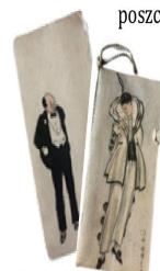
karnety balowe, XIX w., z kolekcji prywatnej P. Michniewskich

Karnawałowe spotkania odbywały się według określonego schematu. Kolejność poszczególnych tańców notowano w karnecikach, specjalnie na tę okoliczność przygotowywanych dla panien przez gospodarzy balu. Tancerki uzupełniały je uwagami o partnerach w mazurach, galopkach i kontredansach. Niewielkie, ślicznie ozdobione notesiki przechowywane potem były przez lata jako sentymentalne pamiątki młodości.