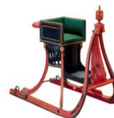
sanie szlichtadowe, XVIII w., ze zbiorów Muzeum Narodowego w Warszawie

Okres między Epifanią a Środą Popielcową, noszący miano karnawału (z wł. carne vale – żegnaj mięso ), to czas zabaw, ulicznych pokazów, parad i tańców. Obecny także u nas, nazywany był zapustami lub mięsopestem . Wiele jego elementów przywędrowało do Polski prawdopodobnie wraz z królową Boną i pomimo tego, że polski karnawał nie dorównał nigdy tym w Rio de Janeiro, Wenecji czy Londynie, zdomował się u nas na dobre. Zimą, gdy za oknami śnieg i mróz, roztańczone pałace i ziemiańskie dworki gościły ziemian z całej okolicy. A świętowanie poprzedzały staropolskie kuligi. Te swoiste pokazy strojów, pojazdów, koni i ozdobnych uprzęży były prawdziwymi eskapadami, trwającymi wiele karnawałowych dni. Ich organizacja stanowiła nie lada wyzwanie. Z dworu do dworu przemieszczali się uczestnicy takiej szlichtady (z niem. kulig), a w każdym z nich dominowała zabawa, muzyka, biesiadowanie i tańce, niejednokrotnie do białego rana. Następnego dnia – kolejny dwór i zabawa zaczynała się od nowa.